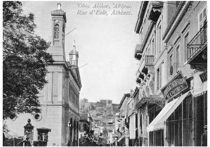
Η Αγία Ειρήνη από την οδό Αιόλου το 1852. Στο βάθος η Ακρόπολη

Έτσι γιόρτασαν στην Αθήνα τού 1852 τη μνήμη των Τριών Ιεραρχών, αποδίδοντας σε αυτούς όχι μόνο την