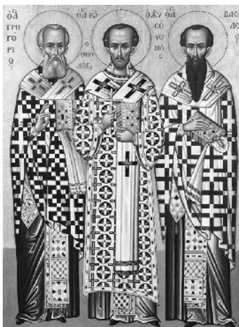
Οι Τρεις Ιεράρχες

Στο σημείο αυτό πολλοί από το εκκλησίασμα έστρεψαν το βλέμμα τους προς τις νεαρές Αρσακειάδες. Εκείνες βέβαια ούτε που τόλμησαν να σηκώσουν το κεφάλι τους. Μα κατάλαβαν την ικανοποίηση και τη χα-